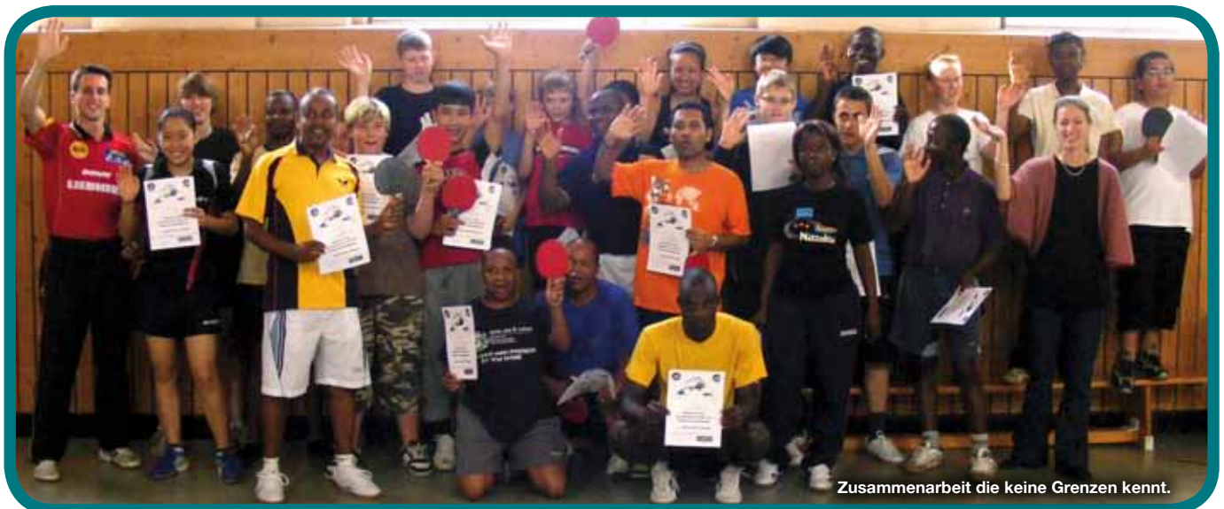
Zusammenarbeit die keine Grenzen kennt.