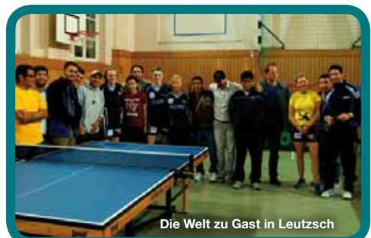
Die Welt zu Gast in Leutzsch