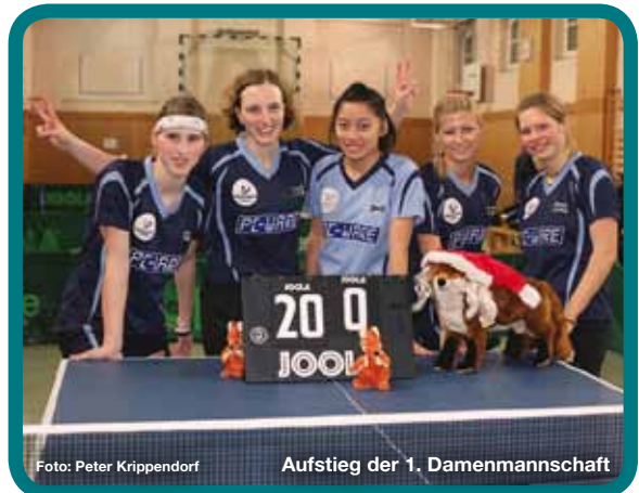
Aufstieg der 1. Damenmannschaft