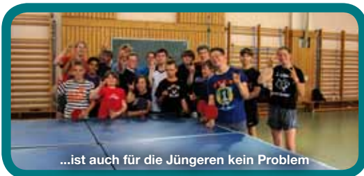
...ist auch für die Jüngeren kein Problem