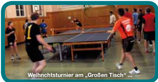
Weihnachtsturnier am „Großen Tisch“ ...