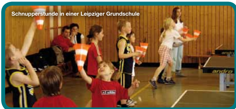
Schnupperstunde in einer Leipziger Grundschule